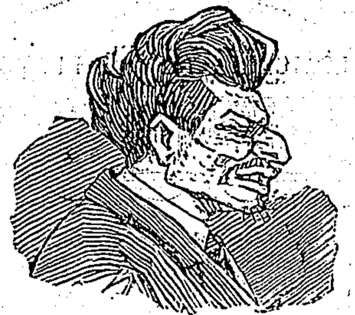
Ignacio M. Altamirano.

Dicen que ardiente y que terrible fuera, De alma muy grande y cuerpo muy exiguo: Nunca el dictado mereció de ambiguo Y algún tiempo llamáronle hasta fiero.