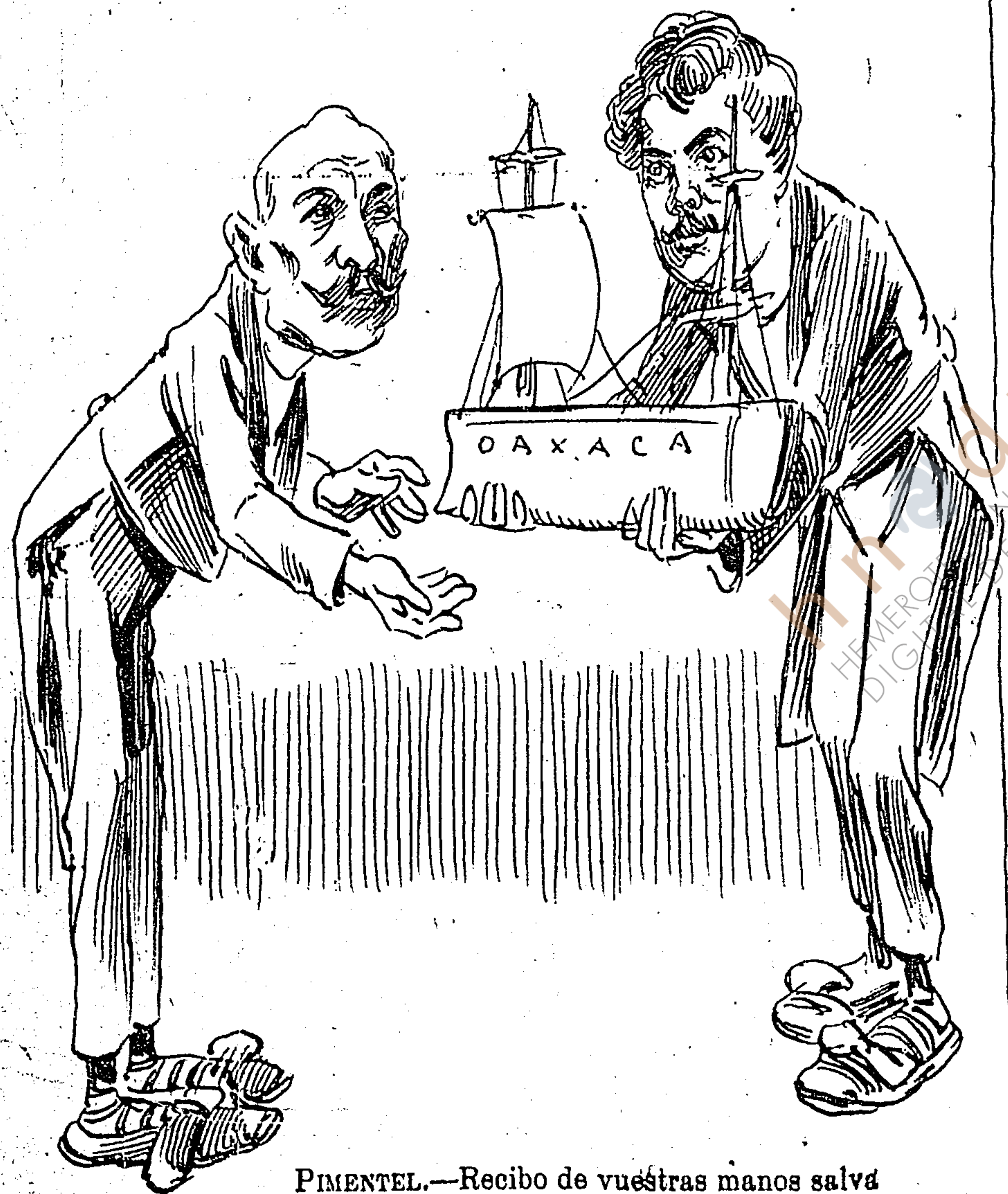
PIMENTEL.—Recibo de vuestras manos salva é ilesa la nave del Estado.