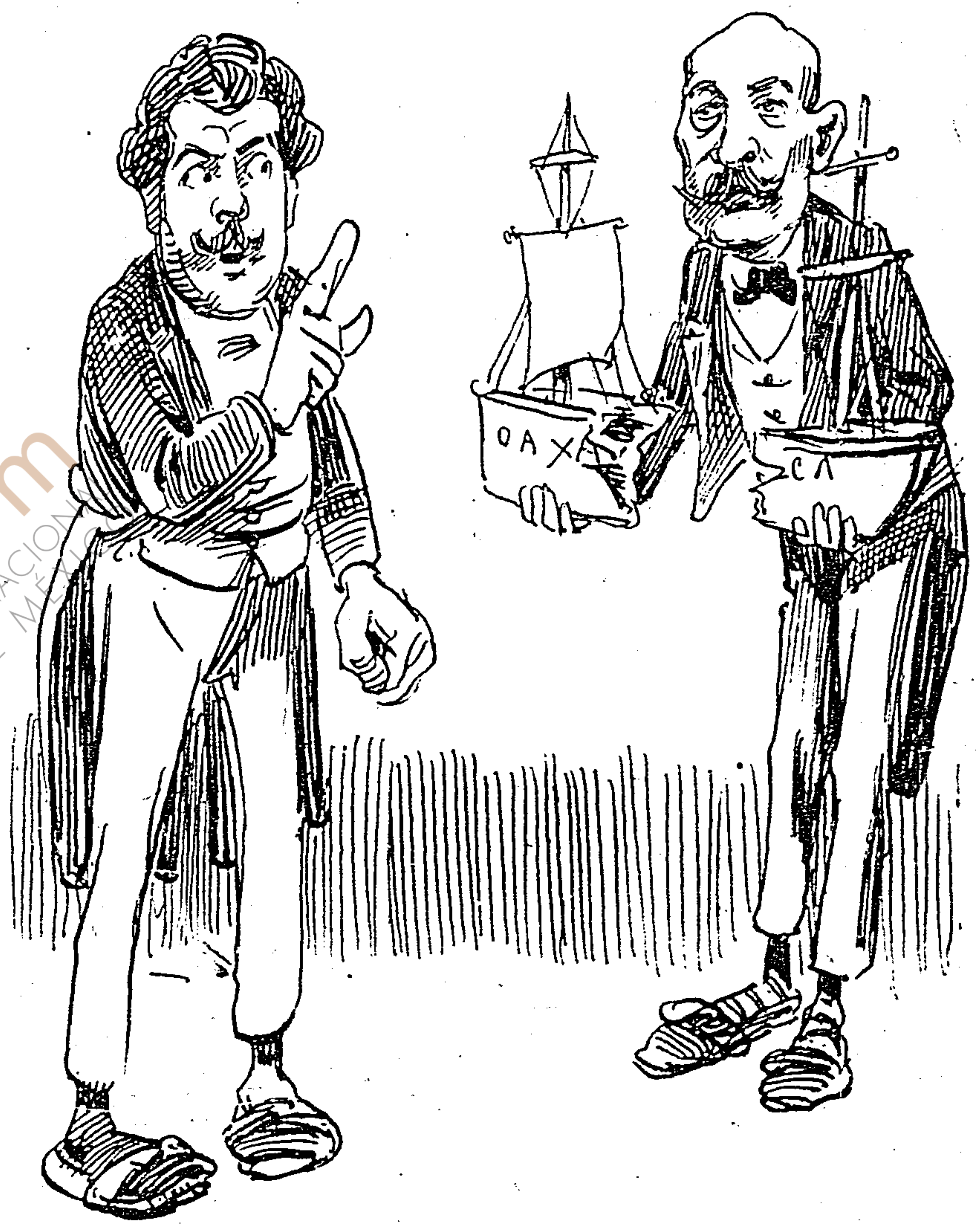
BOLAÑOS CACHO.—Salido el dinero ó efectos, no se admite reclamación.